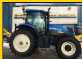
NH T7.170, 2015, 171HP, 1375H., AutoCommand (50KM/H), susp cab, joystick, valve centrale, 3 sorties arr.

Location disponible sur certains modèles récents d'usagés sans surcharge