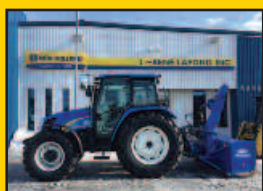
NH T5050, 2011, 1850H., 24X24 inverseur hydraulique, 4 sorties arr., joystick, valve centrale