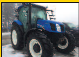
NH T6.140, 2015, 143HP, 400H., AutoCommand (50 KM/H), 3 sortie arr., valve centrale, joystick