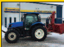
NH TS100A, 2004, 100HP, 3575H., 16X16 Powershift, sub frame, joystick, 2 sorties av., 2 sorties arr.