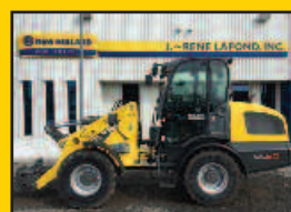
WN WL60, 2015, 102HP, 1450H., A/C et chauffage, quick hydraulique (skid), pneus 405/70R18