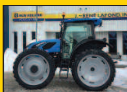
Landini 5-110D, 2015, 215H., vitesse rampante, 4 sorties, haute clearance, pneus 270/80R44