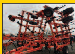
Cultivateur Kuhn 5635-30, 2016, 30 pieds, avec tire arrière pour trainer un rouleau.