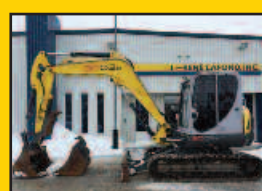
WN 8003, 2014, 2625H., pouce, attache rapide mécanique, chenille d'acier, sortie auxiliaire, 2 godets