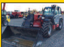
Manitou MLT840, 2013, 115HP, 3050H. ride control, hard throttle, attache rapide hydraulique, set de fourches