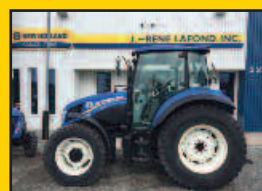
NH T4.95, 2015, 95HP, 480H., 24X24 inverseur hydraulique, 2 sorties arr., pneus à neige Nokian