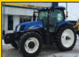
NH T6070 PLUS, 2012, 140HP, 3150H., 16X16 Powershift, 4 sorties arr., 2 sorties av., joystick