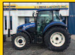
NH T4.85, 2014, 84HP, 755H., 16X16 inverseur hydraulique, 2 sorties arr., joystick, valve centrale