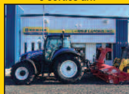
NH T5.105, 2015, 104HP, 450H., ElectroCommand, 3 sorties arr., pneus agricoles