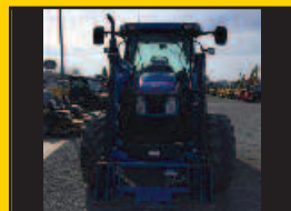
NH T6020, 2011, 5460H., 16X16 Powershift, chargeur auto-nivelant, 3 sorties arr., suspension cabine